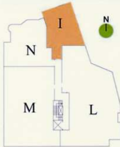
Planta 7ª Nº 21